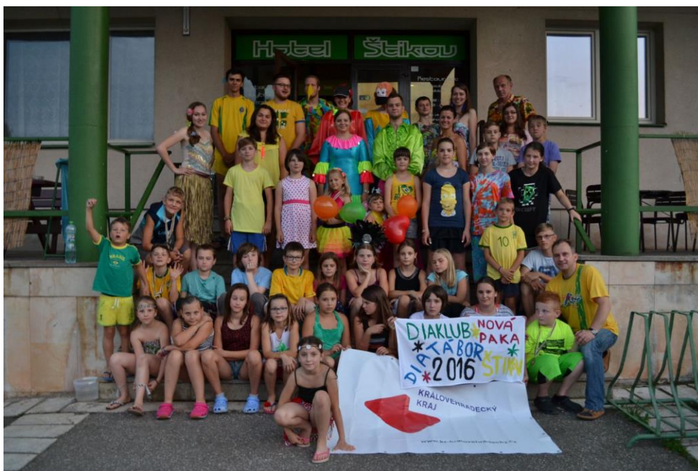
Nadační příspěvek – ozdravný pobyt diabetických dětí ČR v Českém ráji „Brazilské léto“ Diaklub Nová Paka