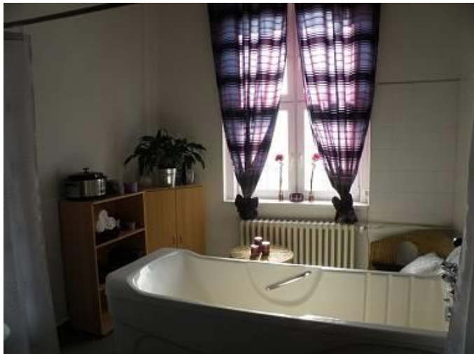
Rehabilitační místnost 29. 3. 2013 09:32

Asi jako většina neziskových organizací, tak i Dobromysl se snaží hledat finanční zdroje a podporu ve státním i veřejném sektoru.