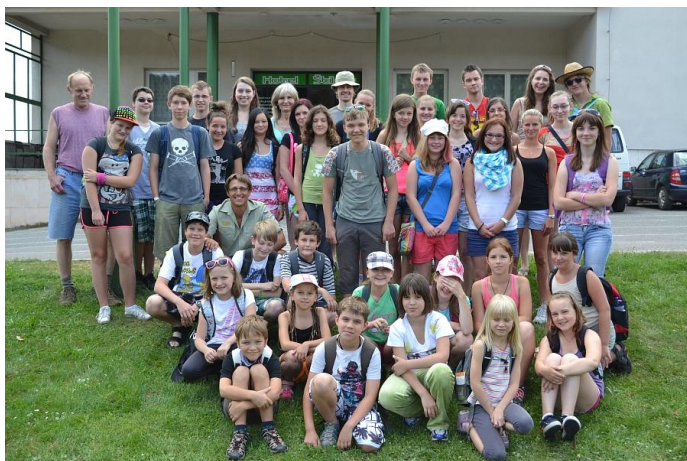
Nadační příspěvek – ozdravný pobyt diabetických dětí ČR v Českém ráji „Po stopách pravěkých lovců“ Diaklub Nová Paka